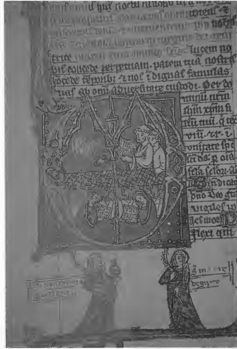
2. Llibre d'hores de la Biblioteca Koninklijke de la Haya, fol. 187v° (1300-1310).