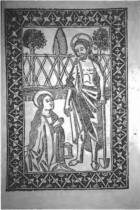
1. Escena del Noli me Tangere del llibre de Jaume Gaçull- La vida de santa Magdalena en Cobbles (escrit al 1496, publicat a València al 1505).